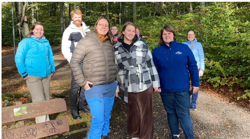
Jubas sentralstyre (Eddy var reist da bildet ble tatt)

Styrets viktigste oppgaver i 2022 har vært å jobbe etter arbeidsplanen som ble vedtatt av Landsmøtet 2021. Her er medlemsoppfølging, medlemsvekst og rekruttering av ledere et viktig punkt, og som vi har lyktes med i 2022.