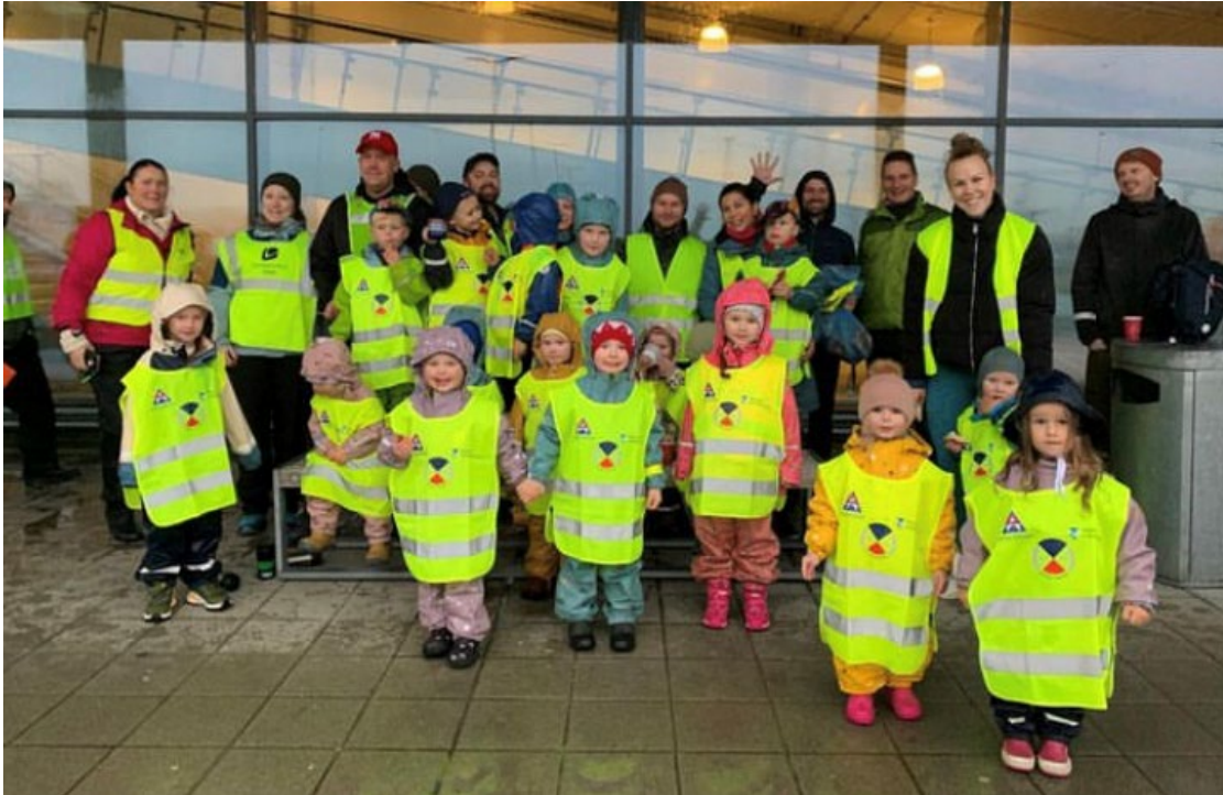
Juba Åsane- refleksens dag

Det har vært god aktivitet i Jubas lokallag etter gjenåpningen. Våre frivillige ledere har kommet i gang igjen for fullt. 15 lokallag har søkt om støtte fra Frifond-midler (LNU). Teateroppsetninger, kunst- og håndverksaktiviteter, markering av refleksens dag, dans, søppelrydding i nærmiljøet, akedager, kino, Jubadisko, ponniriding og kjemiekksperiment-kveld er bare noen eksempler på aktivitet. Det er verdt å merke seg at Jubakvelder der man samles til fri lek er kjempepopulært. Å være sammen og leke er viktig og noe mange har savnet de siste årene. Vi er glade vi kan legge til rette for det.