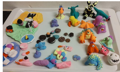
Fra Jubas kulturverksted