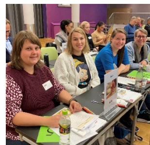
Jubas delegater på Actis-kongressen