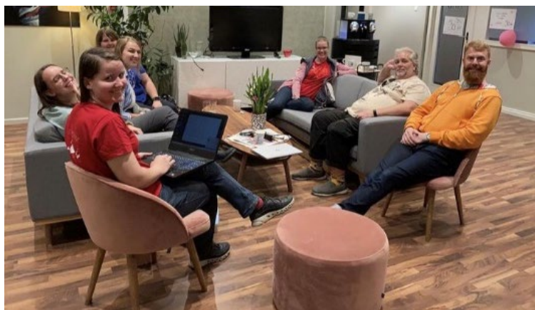
Jubas sentralstyre på landsmøtet i torggata